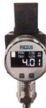
Рисунок 4 - Общий вид датчиков давления тензорезистивных ASZ