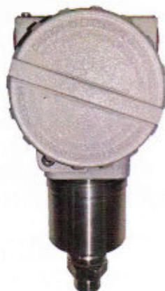
Рисунок 3 - Общий вид датчиков давления тензорезистивных AMZ