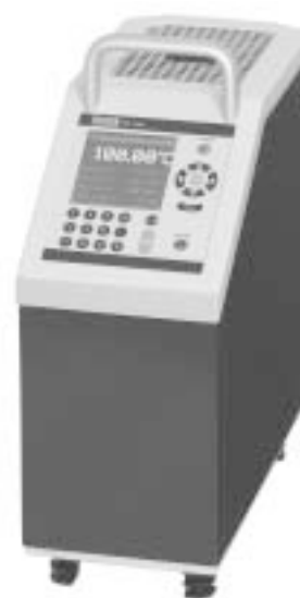
Сухоблочный термостат CTD 9300

Возможны две модели с различными измерительными диапазонами. Модель CTD 9300-160, воспроизводит температуры от -30 °С до 160 °С, что наиболее подходит в индустрии биотехнологий, также как в фармакологии и пищевой промышленности.