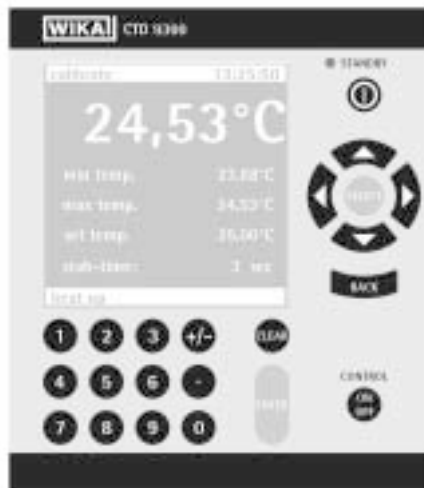
Меню измерений и калибровки

С измерительным прибором, который может встраиваться в существующие калибраторы, Pt 100, термопары и 4-20 мА токовый сигнал, можно измерять и переводить в температуры, также сличать с внешними термометрами сличения. Автоматическая калибровка возможна при использовании РС/ноутбук и калибровочного оборудования.