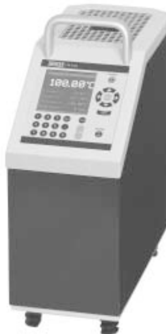
Сухоблочный калибратор температуры CTD 9300